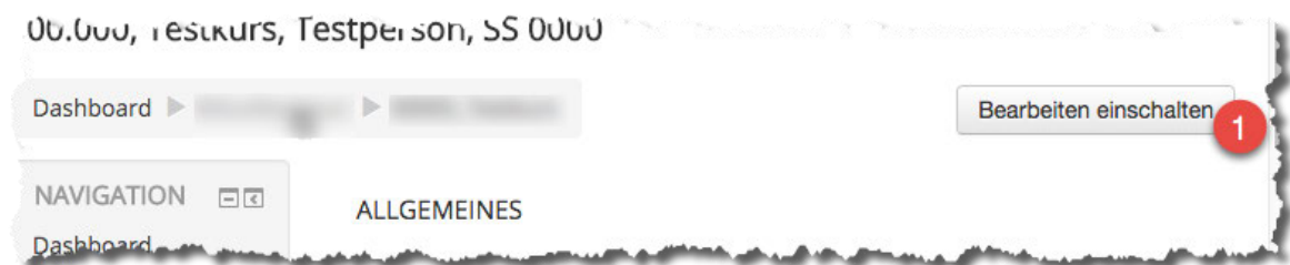
Abbildung 1: Bearbeiten einschalten